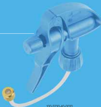
100-5230-40-0020 pompa Mercury Super 360 Mercury Super 360 pump насос Mercury Super 360