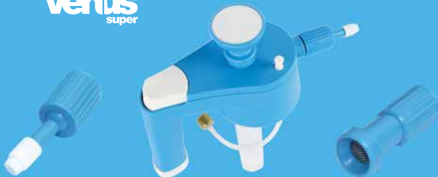
690-6315-40-0050 końcówka przegubowa adjustable spray nozzle шарнирная насадка