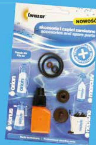
690-6315-00-0190 części zamienne Venus Venus service set сервисный набор Venus