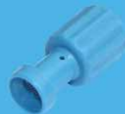
100-4210-40-0010 dysza spieniąca foaming nozzle пенообразующая форсунка