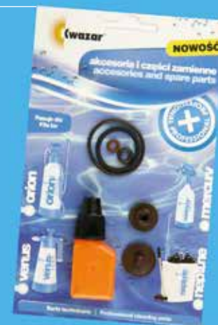
690-6315-00-0190 części zamienne Venus Venus service set сервисный набор Venus