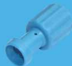
100-4210-40-0010 dysza spieniąca foaming nozzle пенообразующая форсунка