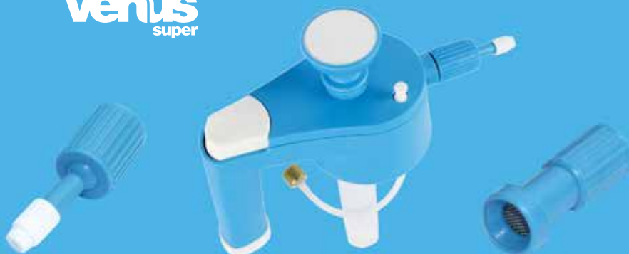
690-6315-40-0050 końcówka przegubowa adjustable spray nozzle шарнирная насадка