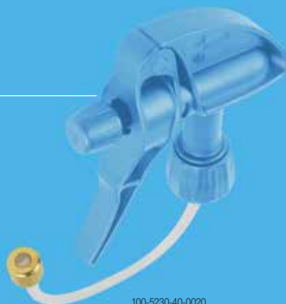
100-5230-40-0020 pompa Mercury Super 360 Mercury Super 360 pump насос Mercury Super 360